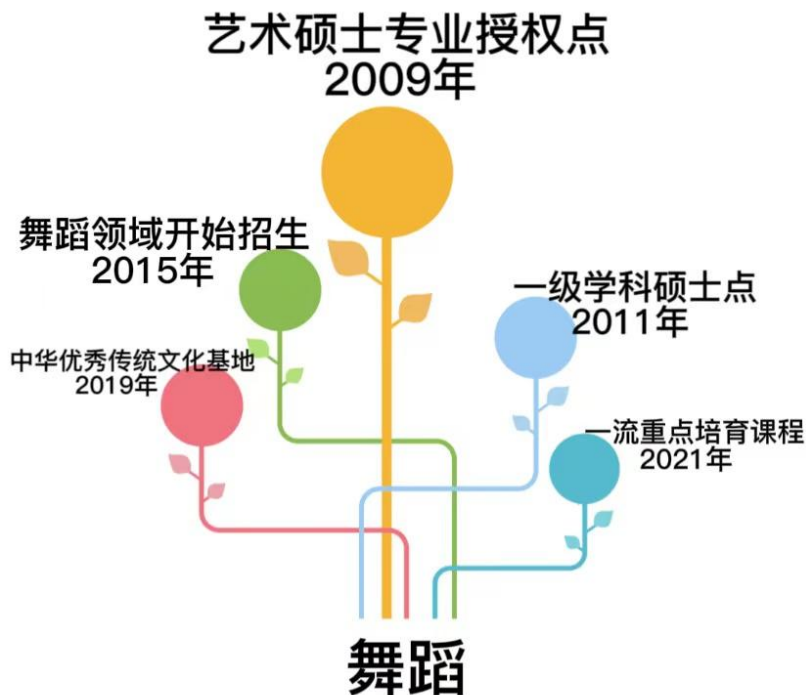
图 1: 学位授权点发展历史