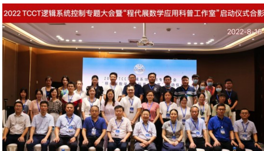
2022 TCCT 逻辑系统控制专题大会