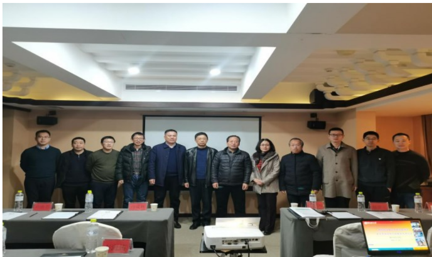
2022 复杂系统分析与控制学术研讨会

本年度成功举办全国性重要学术会议 1 场， 2022 复杂系统分析与控制学术研讨会， 协办 2022 TCCT 逻辑系统控制专题大会。