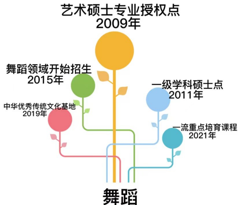
图 1：学位授权点发展历史